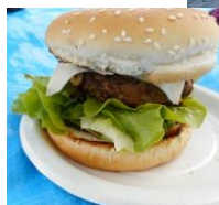
↑公園で ハンバーガー作り