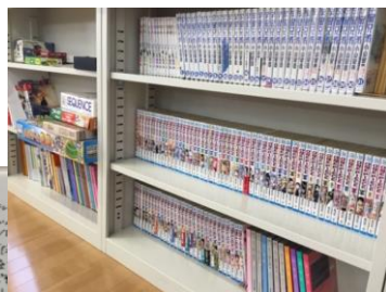
デイケア内の⇒ 本棚