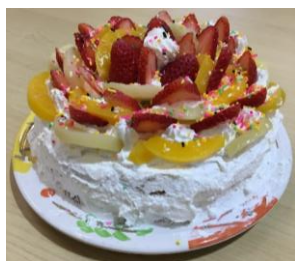
↑クリスマス会での ケーキ作り